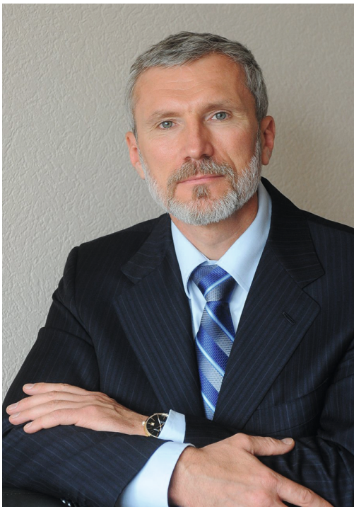
ПРЕДСЕДАТЕЛЬ ПАРТИИ «РОДИНА» Алексей ЖУРАВЛЁВ