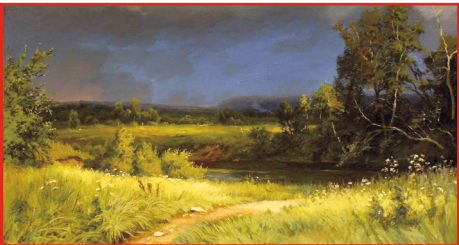
И. Шишков. «Перед грозой»