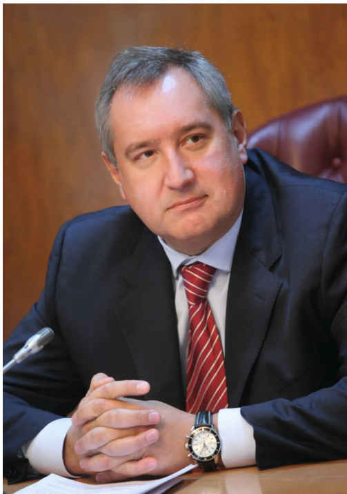
ОСНОВАТЕЛЬ ПАРТИИ «РОДИНА» Дмитрий РОГОЗИН